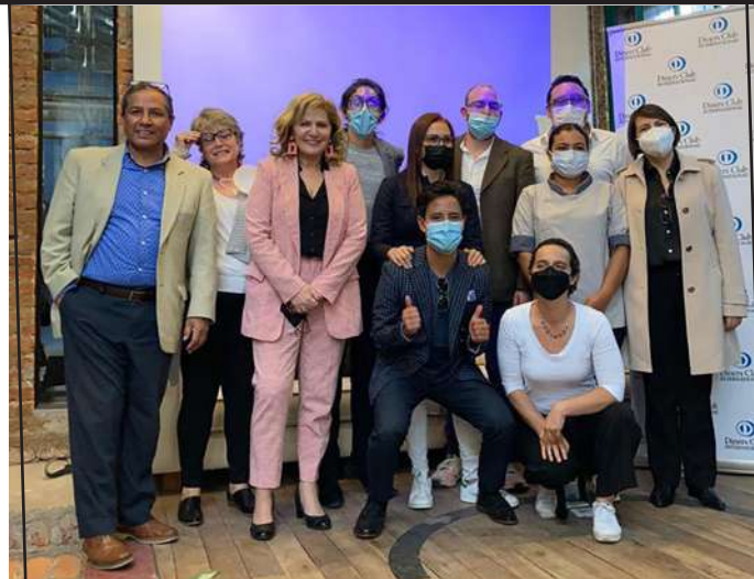
Ganadores del 'Reto Gastronómico' junto a los representantes de Diners Club del Ecuador e Impacto Quito.

Diners Club del Ecuador – Responsabilidad Social, en alianza con Impacto Quito, anunciaron al Restaurante "El Complejo", 59Tres y Verde & Maní como los tres emprendimientos ganadores del 'Reto Gastronómico Diners Club'. Una iniciativa que busca fomentar el crecimiento de negocios gastronómicos en el país.