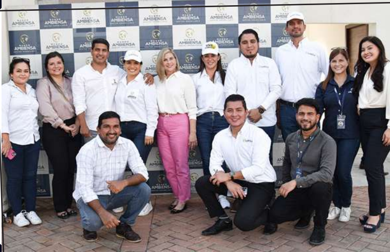
Grupo ejecutivo de Mundo AmbienSA.

Mundo AmbienSA además de brindar múltiples plazas de empleo en el Ecuador, suma un valor más dentro de su misión: la empatía. Esta vez como parte de su responsabilidad social implementa un programa de reconocimiento y bonificación para más de 1.600 obreros.