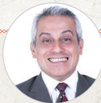
Boris Ledesma @boris.ledesma