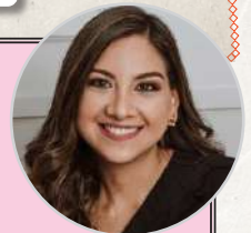
Paola Sánchez @nutricionistapaolasanchez